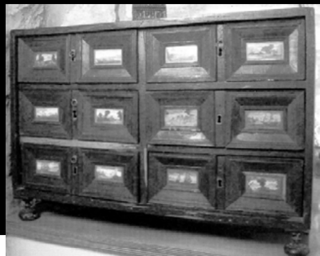
Arquilla construïda a Barcelona amb dotze aquarel·les al davant dels sis calaixos. Monestir de Pedralbes.