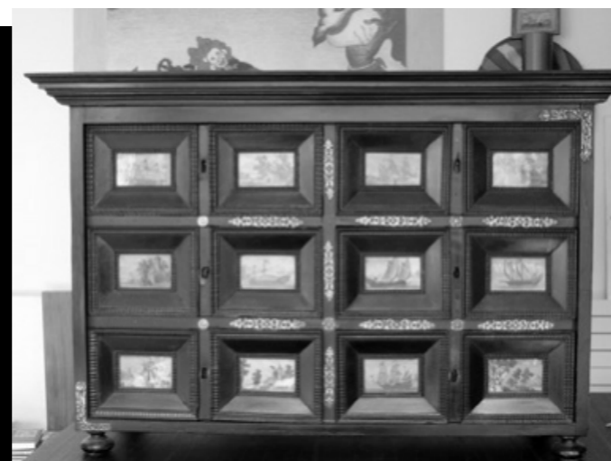
Arquilla barcelonina també decorada amb aquarel·les i aplicacions de bronze.