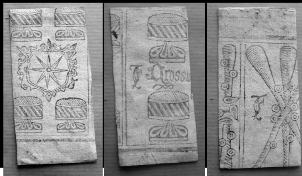
Revers de tres de les aquarel·les de l'arquilla del Monestir de Pedralbes on trobem xilografies de cartes fetes a Barcelona.